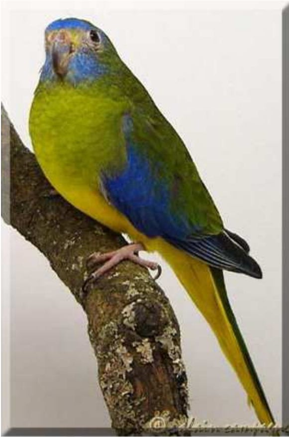
Fotografía cedida con el permiso del autor: Alain Campagne.