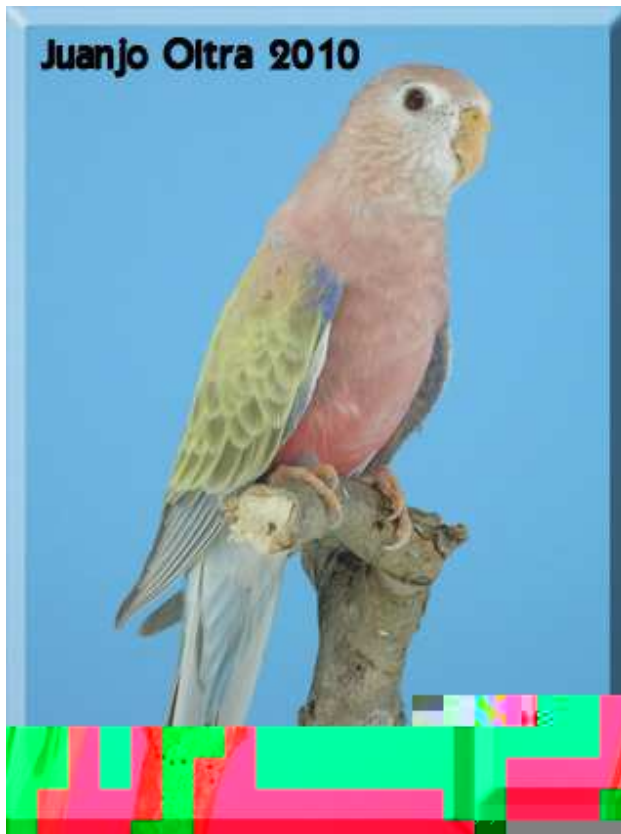
Hembra Bourke Pale Fallow.

Cabeza y cara: Banda frontal azul que se extiende hasta las cejas, muchas veces casi inapreciable. Lores y alrededor de los ojos blanco. Resto de la cabeza rosa con un ligero toque de beige, más claro en las mejillas y la garganta.