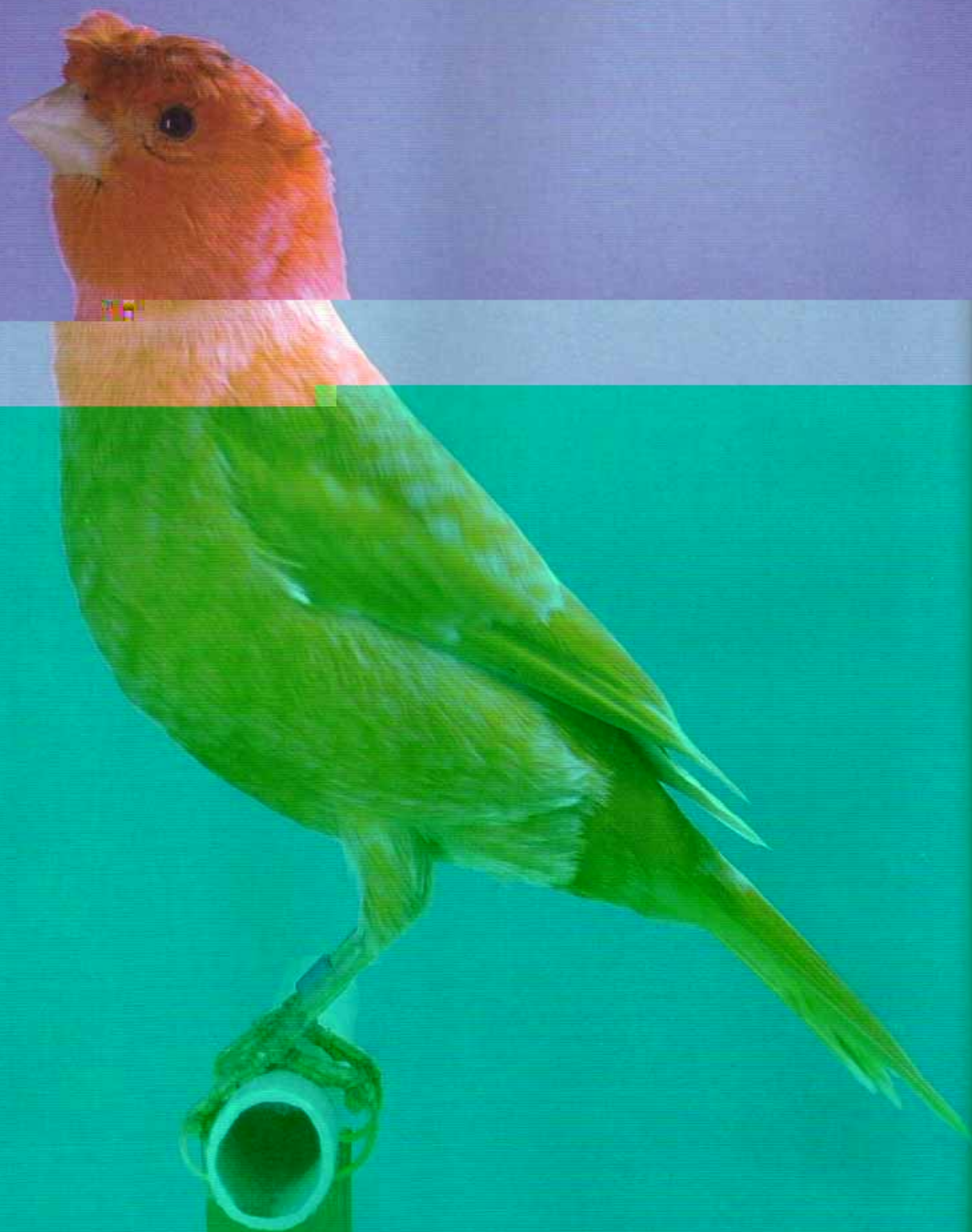
Magnífico ejemplar de Moña Alemana.