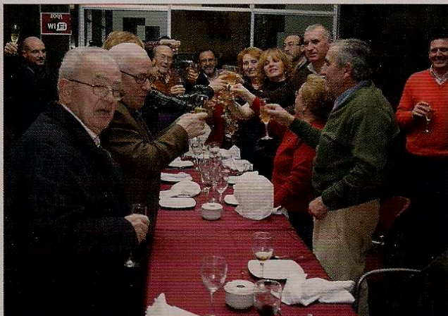
Brindis por el acuerdo en los conceptos de la planilla.

Con todo, no hay que apresurarse en lograrlo, es momento para trabajar.