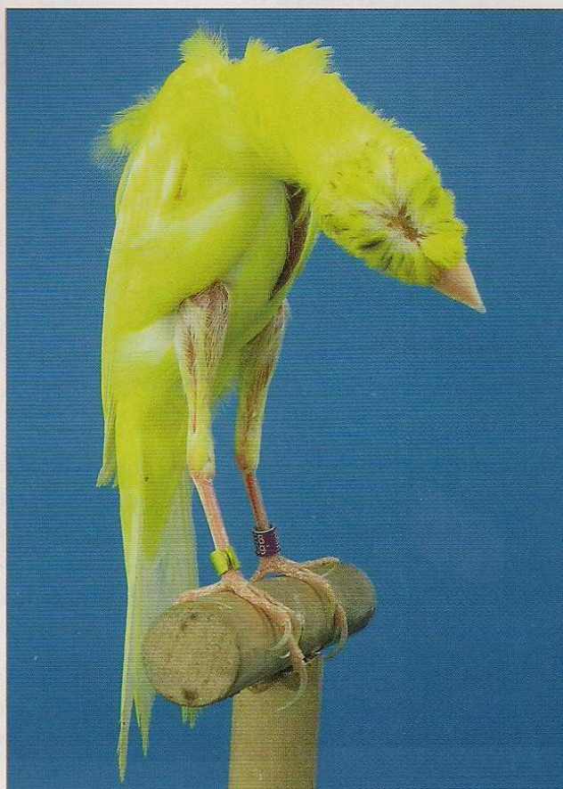
Defecto en el punto central.