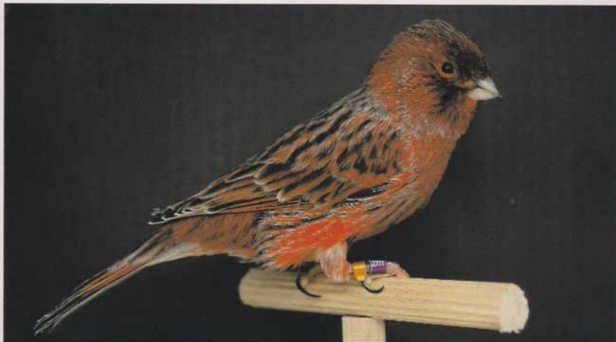
Macho Negro rojo nevado. En el que podemos apreciar un buen lipocromo y una buena distribución de la nevadura, si bien acumula demasiada alrededor del cuello. Tiene una buena talla y forma. El pájaro adopta una correcta posición. Falta oxidación en partes córneas y un diseño dorsal y en flancos más ancho.

En los canarios lipocromos supone la descalificación del ejemplar la presencia de manchas melánicas en cual-