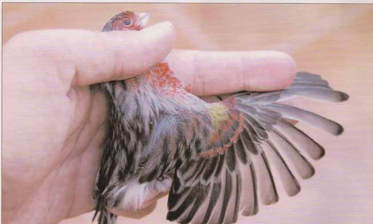
Ejemplar macho negro rojo mosaico. Detalle del ala, donde se aprecian plumas del hombro sin pigmentar. Esas plumas deben ser arrancadas unos dos meses antes de los concursos para que se presenten correctamente pigmentadas, sino serán penalizados en el apartado de lipocromo en la planilla.

En este caso, y siguiendo este criterio, no deberíamos de presentar machos con escasa presencia de lipocromo en las zonas de elección, como máscaras muy cortas, máscaras partidas, aunque tampoco es conveniente que la presencia del lipocromo peque por exceso.