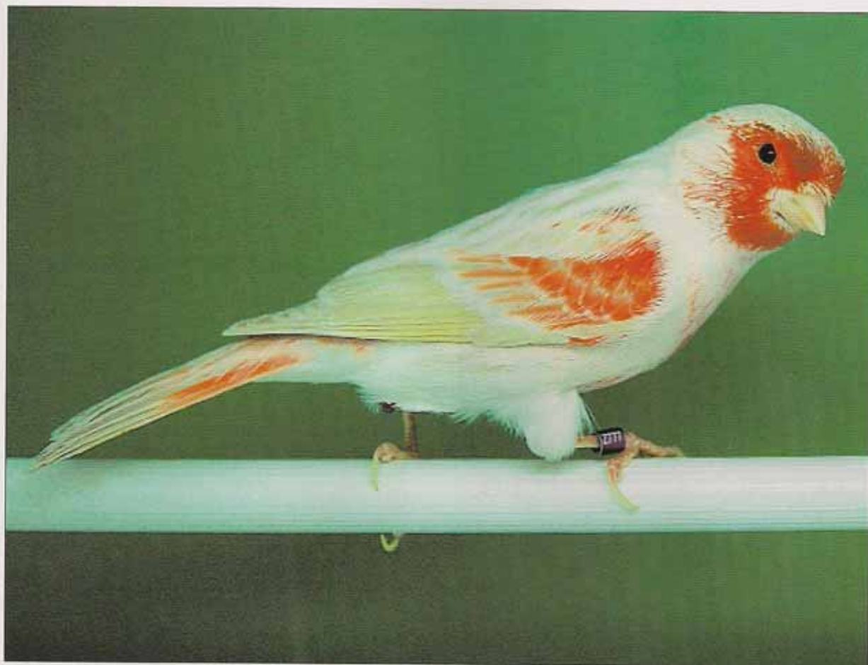
Macho Satiné Rojo Mosaico. Podemos apreciar que las plumas de la cola están pigmentadas, por lo que será penalizado en el apartado de categoría. Según el estándar del CJA.

peratura ambiental en el momento que lavamos los pájaros, ya que corremos el riesgo de que mueran por hipotermia. Yo aconsejo meterlos unos minutos en una jaula enfermería hasta que se hayan secado el plumaje. El lavado del plumaje del pájaro nunca debe hacerse el mismo día o el día previo al concurso, sino varios días antes, ya que una vez el plumaje está limpio, necesitará de unos días para que éste adopte una perfecta posición, brillo y adherencia al cuerpo.