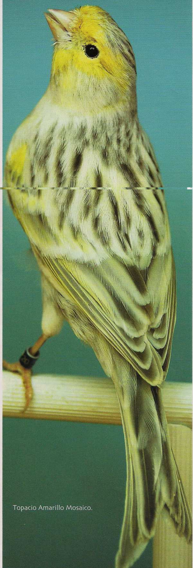
Topacio Amarillo Mosaico.