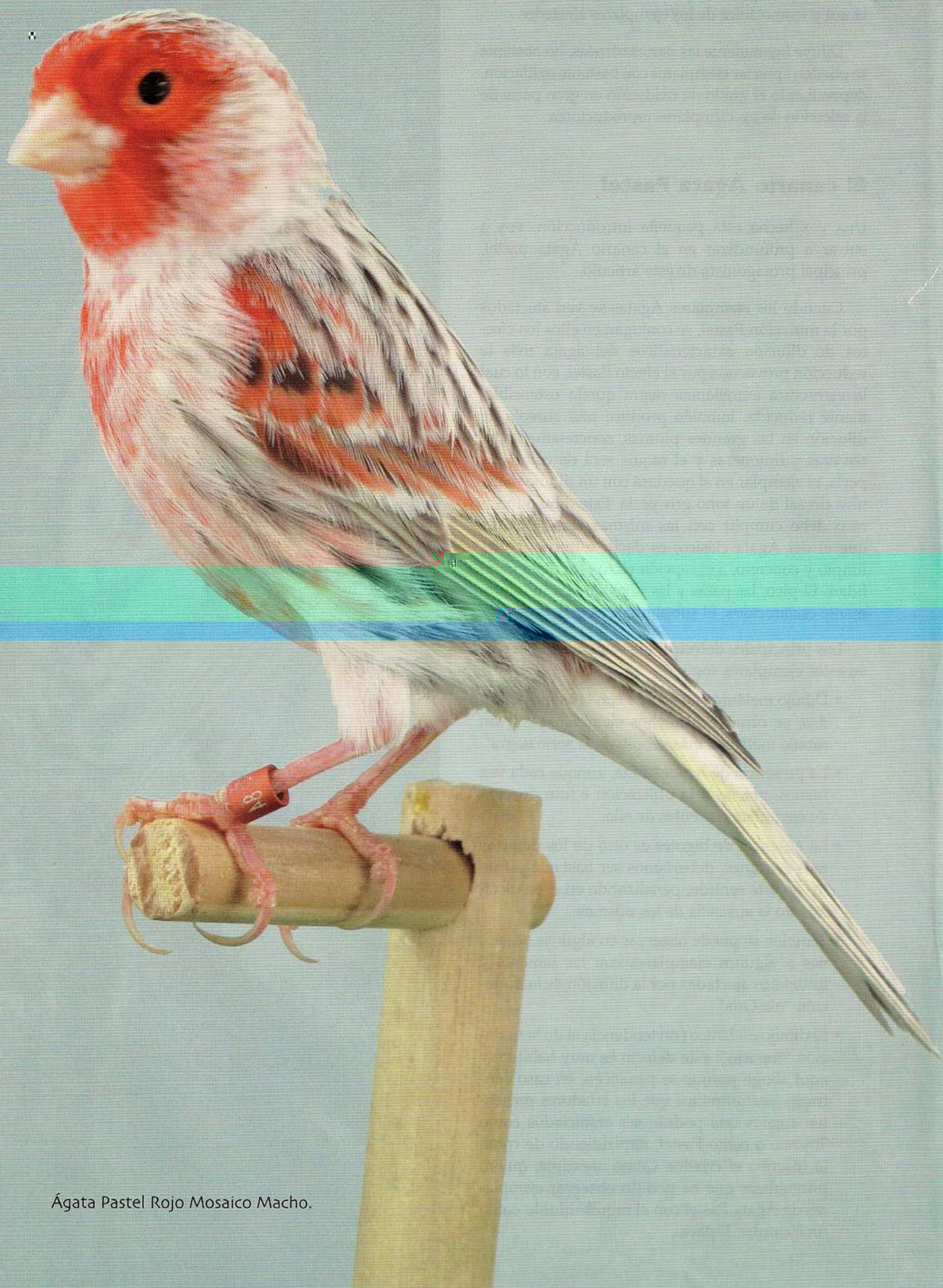
Ágata Pastel Rojo Mosaico Macho.