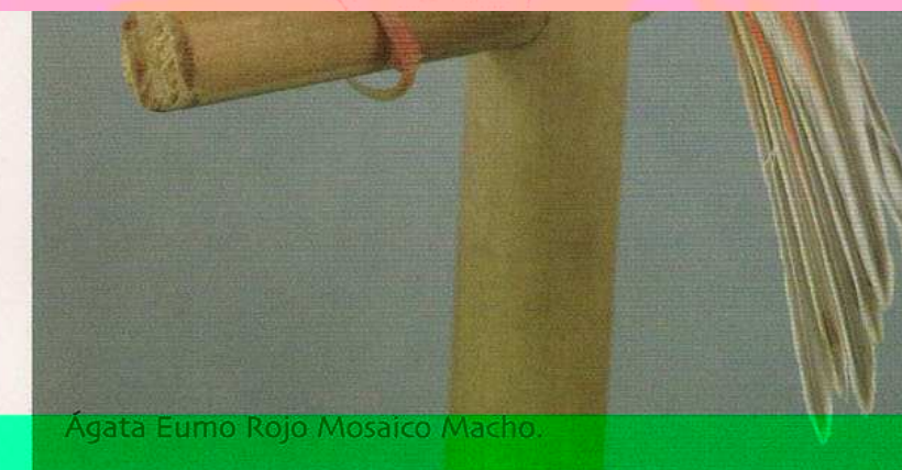
Ágata Eumo Rojo Mosaico Macho.